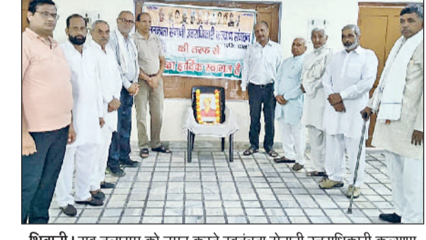
भिवानी। राव तुलाराम को नमन करते स्वतंत्रता सेनानी उत्तराधिकारी कल्याण संगठन के सदस्य।