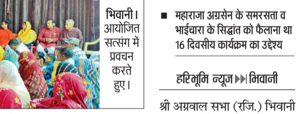
भिवानी। आयोजित सत्संग में प्रवचन करते हुए।