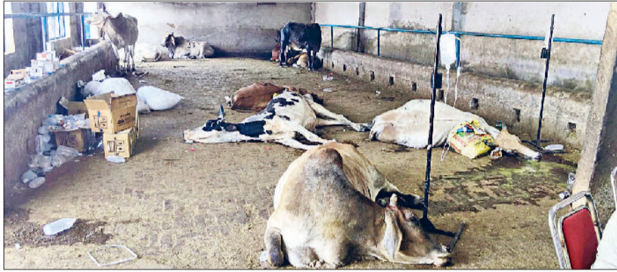
भिवानी। उपचाराधीन क्षमता से अधिक रोटियां और तला हुआ खिलाने से बीमार हुई गाय और बीमार गायों का उपचार करते चिकित्सक।