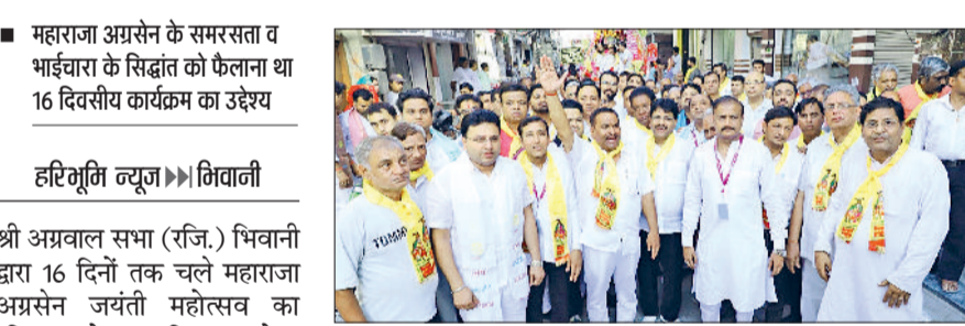
भिवानी। शहर में शोभायात्रा निकालते हुए।