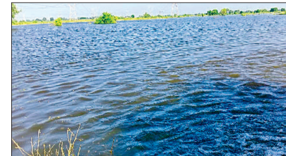
भिवानी। गांव लोहारी जाटू के खेतों में जमा बारिश के पानी का दृश्य।

फिलहाल खेतों में कहीं पर तीन तो कहीं पर चार फुट तक जलभराव ने बढ़ाई परेशानी