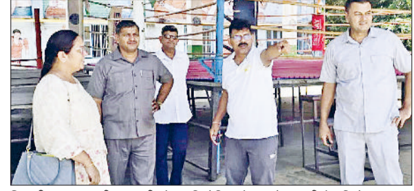
भिवानी। राज्य स्तरीय स्कूली खेल प्रतियोगिता के आयोजन की तैयारियों का जायजा लेते अधिकारी।

हरियाणा विद्यालय शिक्षा विभाग द्वारा आयोजित 58वीं हरियाणा राज्य स्तरीय स्कूली खेल प्रतियोगिता का आयोजन भिवानी में किया जाएगा। यह प्रतियोगिता 24 सितंबर से 26 सितंबर तक भीम स्टेडियम, भिवानी में आयोजित होगी। प्रतियोगिता की तैयारियों का जायजा मंगलवार को