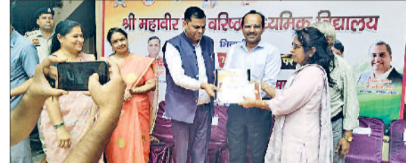
भिवानी। शिक्षकों को सम्मानित करते हुए।