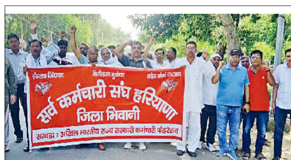
भिवानी। शहर में जुलूस निकालते हुए कर्मचारी।